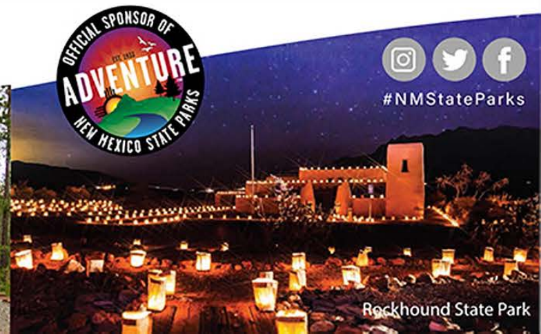
Rockhound State Park