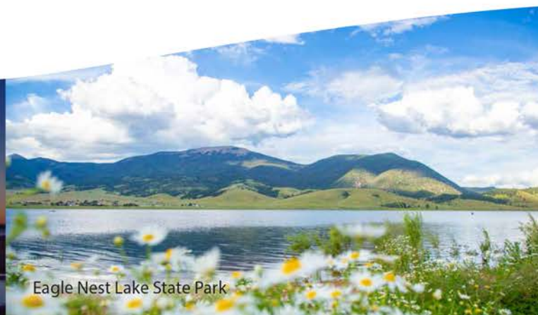
Eagle Nest Lake State Park