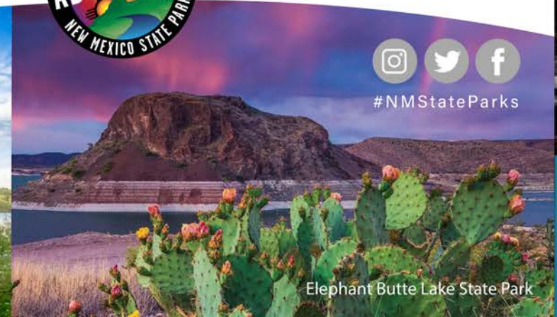
Elephant Butte Lake State Park