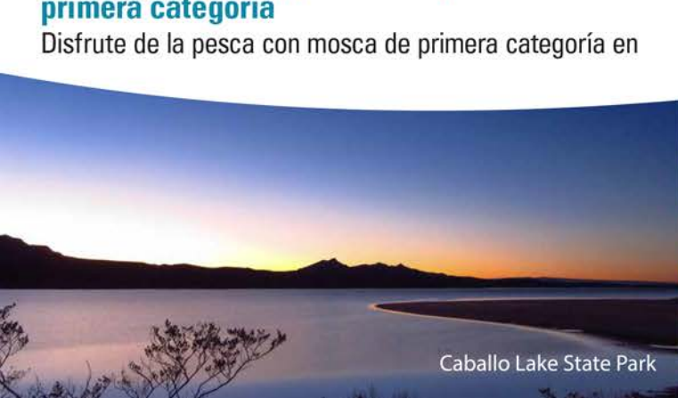
Caballo Lake State Park