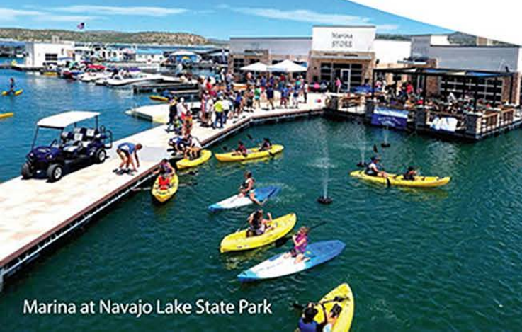
Marina at Navajo Lake State Park

Volunteers are critical to the success of our parks. We are always needing volunteers for a variety of tasks including camp hosting, staffing our visitor centers, hosting park events, maintaining facilities and more. Share your skills today. Apply online at https://www.emnrd.nm.gov/spd/volunteering/ .