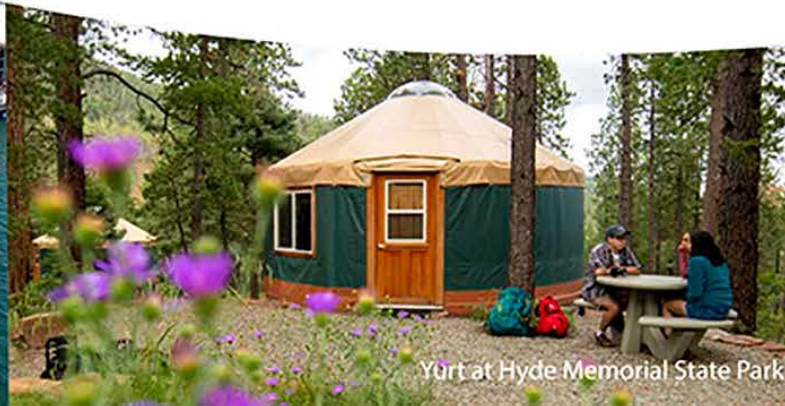
Yurt at Hyde Memorial State Park